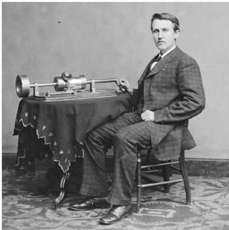
Томас Эдисон и его фонограф [5]

Фонограф Эдисона — музейный экспонат и больше не используется, но во время посещения Королевского института Великобритании я на другом аппарате записал «Рассвет» Альфреда Теннисона. Я выбрал именно это сти-