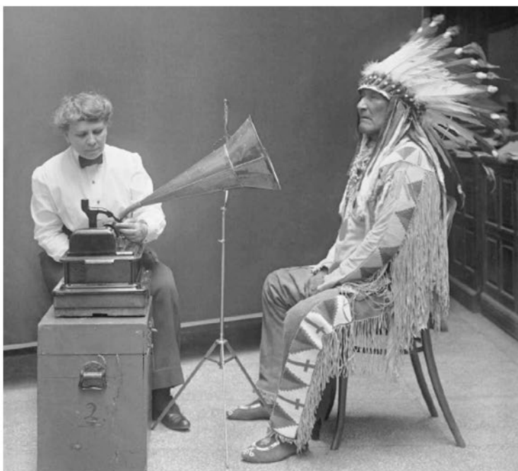
Индеец пиеган и этнолог Фрэнсис Денсмор, 1916

позади» 1 , с современной интерпретацией Дэвида Моррисси. На записи XIX века Ирвинг усиливает свой аристократический голос, используя специальную вокальную технику, разработанную для большой сцены театра. Микрофон же, напротив, освобождает Моррисси от необходимости говорить очень громко, и он произносит строки так, будто выступает перед небольшой аудиторией, при этом четко различимы особенности его хрипловатого голоса. Существенно изменилось и пение. Можно сравнить ранние записи на фонографе оперной суперзвезды