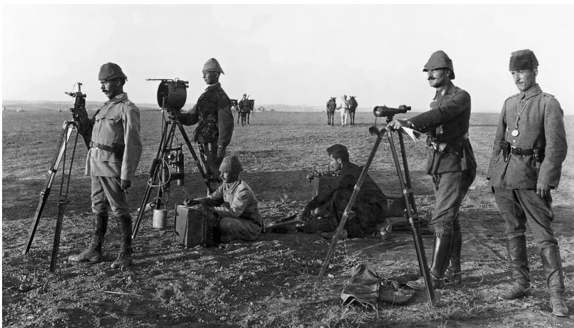
Использование гелиографа в годы Первой мировой войны. Турецкая армия, 1917 г.

В технике связи гелиограф – это оптический телеграф, устройство для передачи информации на расстояние посредством световых вспышек. Главной частью гелиографа служит закрепленное в рамке зеркало, наклонами которого производится сигнализация серией вспышек солнечного света (т. е. «солнечным зайчиком») в на-