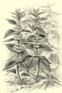
Яснотка, или глухая крапива