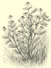
Аптечная ромашка 191