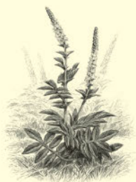
Репешок, или репейничек 205