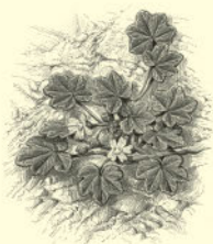
Мальва, или просвирник 147