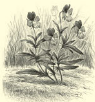
Фиалка трехцветная, или анютины глазки