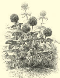
Луговой, или красный, клевер