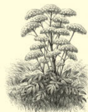
Дудник, или дягиль