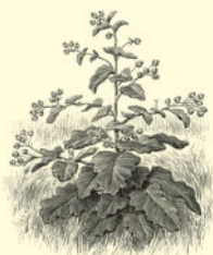
Лопух, или репейник 139