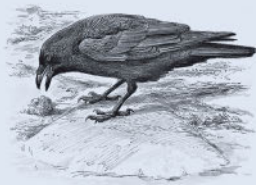
Черная ворона 165