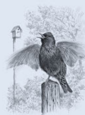
Обыкновенный скворец 207