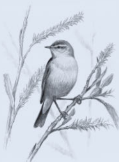
Пеночка-весничка и пеночка-теньковка 69