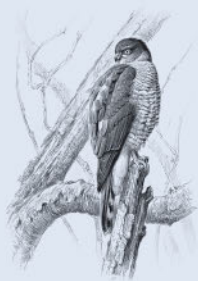
Ястреб- перепелятник 199