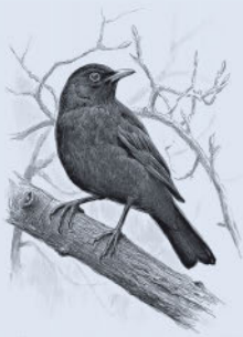
Черный дрозд 19