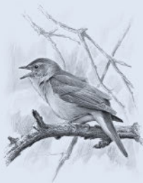
Южный соловей 149