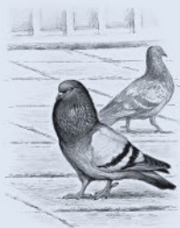
Сизый голубь (домашний) 225