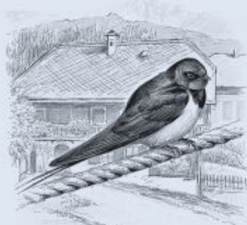
Деревенская ласточка 175