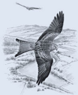
Красный коршун 191