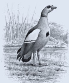
Нильский гусь 157