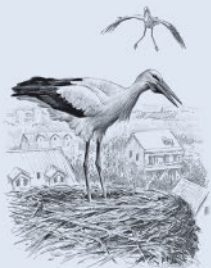
Белый аист 269