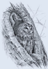
Серая неясыть 251