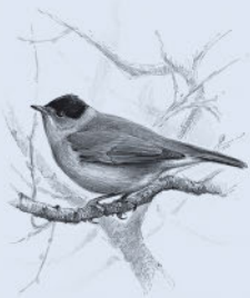
Черноголовая славка 139