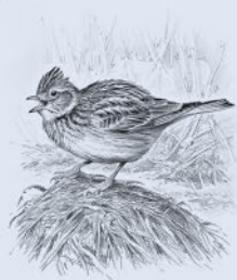
Полевой жаворонок 61