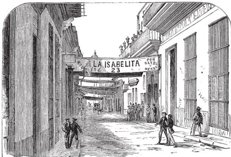
Навес между зданиями на улице О'Рейли в Старой Гаване дает тень для покупателей, 1871 г.

Но есть и другие причины видеть Гавану черно-белой. Из-за американского торгового эмбарго цветную пленку и все, что нужно для ее обработки, купить было негде, поэтому многие годы после революции ведущие фотографы страны, например Рауль Корралес и Альберто Корда, снимали в черно-белом. (Истинный гаванец Корда, автор знаменитого черно-белого портрета Че Гевары, говорил, что стал фотографом, чтобы «знакомиться с женщинами».)