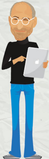
66 Стив Джобс