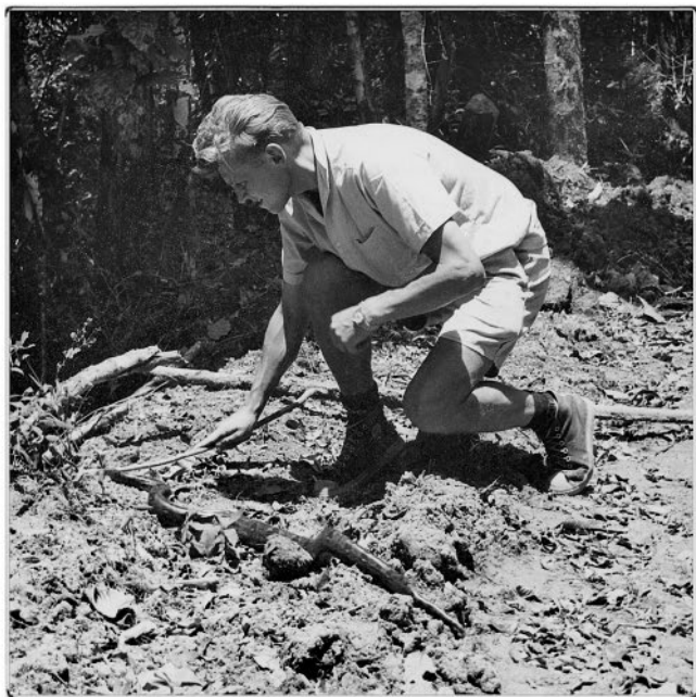
Охота на удава на Мадагаскаре

чался в дикой природе во время нашего посещения этих мест, был истреблен, чтобы эта прекрасная, но хрупкая экосистема вернулась к подобию ее исконного состояния. Наскальная живопись в Нурланджи, которую мы отсняли впервые, сейчас известна всему миру и даже попала на австралийские почтовые марки. Роспись по коре, созданная Магани, художником, который так много рассказал нам о своей работе, теперь находится в коллекции Австралийской национальной галереи. Людей, которые раскрасили скалы около Юендуму, сменили художники, которые используют современные краски. Их холсты сейчас продают за сотни тысяч, а то и миллионы долларов. Чтобы не задеть чувства современных аборигенов, в описаниях туземных церемониальных практик, содержащихся в первом издании, были изъяты некоторые детали.