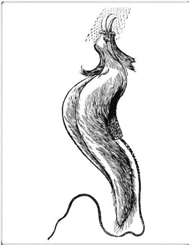
Райская птица на рисунке Альдрованди, 1599 год

Даже спустя двести лет после того, как первые шкурки появились в Европе, родина птиц, «земной рай», по-прежнему оставалась неизвестной. Только в XVIII веке обнаружили, что они живут в Новой Гвинее и на прибрежных островах.