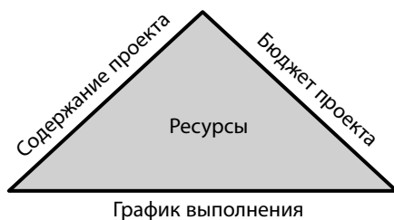
Рис. 1.3. Соответствие цели возможно при соблюдении трех обязательных условий

проекта есть цель. Цель достигается при соблюдении трех граничных условий, как показано на рис. 1.3. Содержание проекта — проектное задание — это описание того, чего как минимум мы хотим достичь по завершении проекта, каков желаемый результат. Бюджет проекта и график выполнения — максимум того, что мы готовы на это потратить. В центре — ресурсы, они связаны с каждым из трех необходимых условий и влияют на них и на успешность реализации проекта.