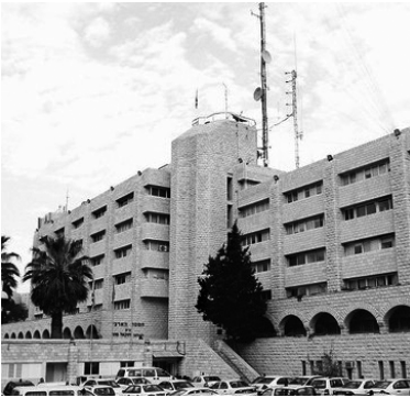
Главный штаб полиции Израиля в Иерусалиме

Израиль разделен на семь административных округов: Северный, Центральный, Южный, Хайфский, Тель-Авивский, Иерусалимский и Иудея с Самарией. В каждом из них имеется своя мобильная лаборатория для расследования тяжких преступлений, подчиненная Отделу. В крупных полицейских участках страны работают в общей сложности 300 экспертов,