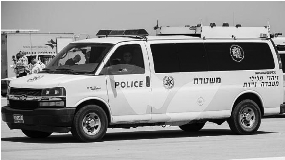
Мобильная криминалистическая лаборатория

Зарботная плата офицеров исчисляется исходя из звания, ученой степени, выслуги лет и научной деятельности. Начинаящие криминалисты получают, как правило, от $1500–2000 до вычета налогов. Деньги, что и говорить, небольшие. Но стимул работать есть. И есть мотивация искать новое и усовершенствовать имеющееся. А откуда они берутся, спросите вы?