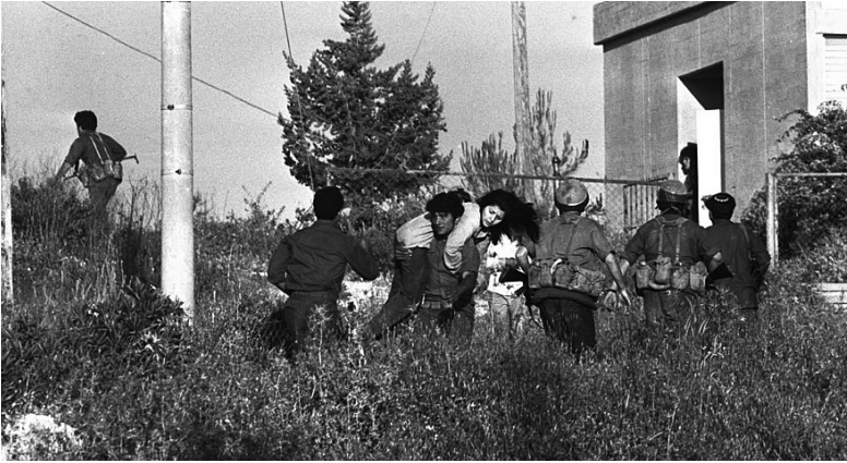
Трагедия в Маалот

страны. В результате запоздалого и неудачного штурма школы армейским спецназом 25 из 115 школьников-заложников погибли.