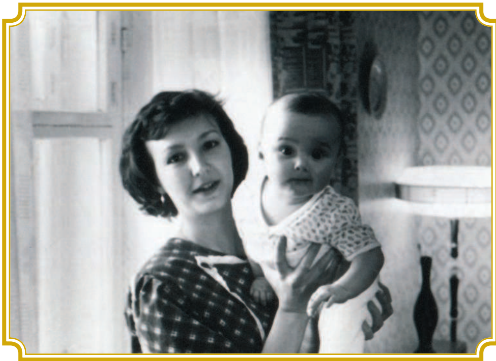
Любимая мамочка всегда поддерживает меня и помогает во всем