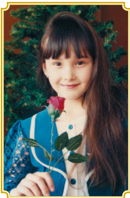
Мне 9 лет