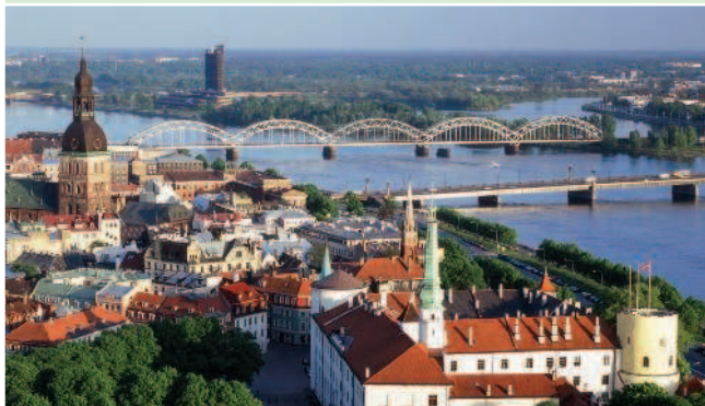
Вид на Даугаву

Нахождение: Латвия, Прибалтика (Северная Европа) Расположение: исторический центр Риги располагается в нижнем течении Даугавы, а северные пригороды находятся уже на южном берегу Рижского залива Площадь: 304 кв. км Высота центра: 28 м