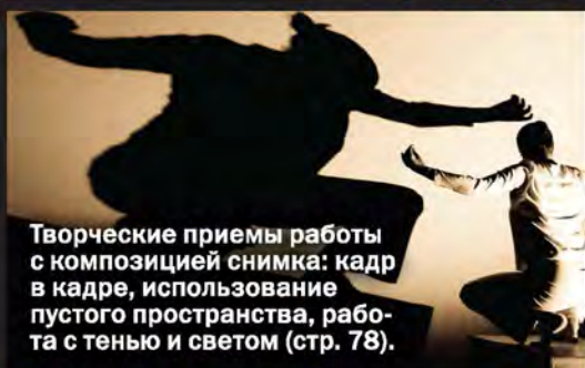
Творческие приемы работы с композицией снимка: кадр в кадре, использование пустого пространства, рабо- та с тенью и светом (стр. 78).

Этот курс посвящен творче- ской составляющей процесса фотосъемки — искусству композиции, правильному выбору и подаче сюжета или объекта съемки.