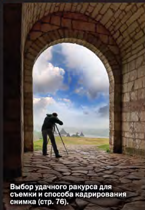
Выбор удачного ракурса для съемки и способа кадрирования снимка (стр. 76).