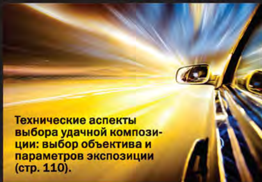
Технические аспекты выбора удачной компози- ции: выбор объектива и параметров экспозиции (стр. 110).