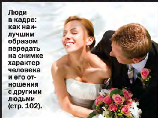
Люди в кадре: как наи- лучшим образом передать на снимке характер человека и его от- ношения с другими людьми (стр. 102).