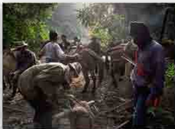
Jade is special, as are the risks in bringing it from mine to market

Основопологающая идея, которую необходимо принять, заключается в том, что как бы сильно нам ни казалось, что каждая из наших фотографий великолепна, это очень маловероятно. Фотографии практически не могут быть равными по степени выразительности; некоторые неизбежно будут «равнее» других. Таким образом, из любой подборки фотографий нужно отобрать лучшие, а затем расположить их наиболее эффективно. Другими словами, один снимок ведет зрителя к другому, подготавливая к нему и повышая его ценность. Если история в фотографиях следует четкой повествовательной линии — такой, как ограниченная по времени последовательность, где некое событие имеет очевидное начало и явное окончание, то структура выстроится сама по себе. Показанный выше очерк «Возвращение на поля смерти» тому пример. Все достаточно просто, если событие полностью отражено на ваших фотографиях.