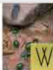
WINNING THE RAT RACE IN INDIA