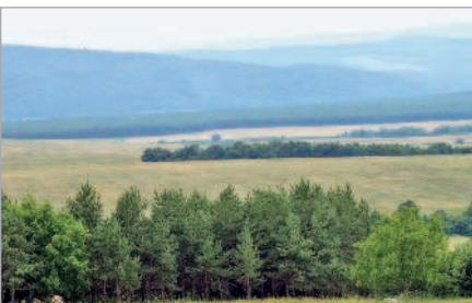
■ Поля и горы Болгарии