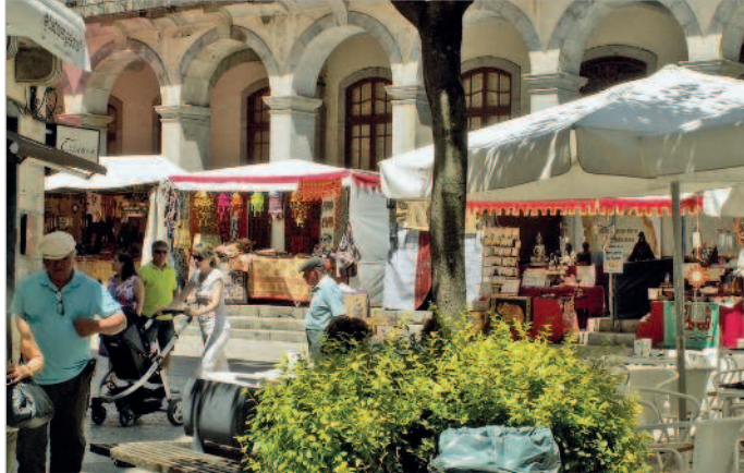
■ Воскресная ярмарка в Браге

Путеводитель по Португалии подробно рассказывает о самых интересных достопримечательностях страны, которые расположены в пяти его важнейших городах – Лисабоне, Порту, Коимбре, Браге и Эворе. Специально разработанные маршруты помогают сориентироваться во времени и пространстве. Тематическая прогулка «Шпионский Лиссабон» погружает в мир секретных агентов Второй мировой войны. Инструкции о том, как само-