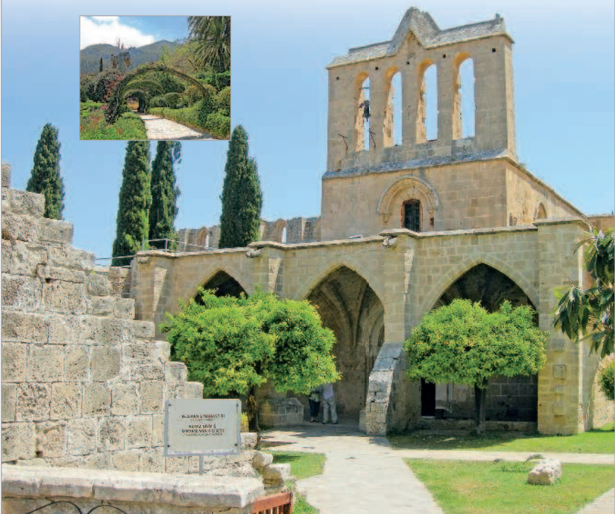
■ Аббатство Беллапаис