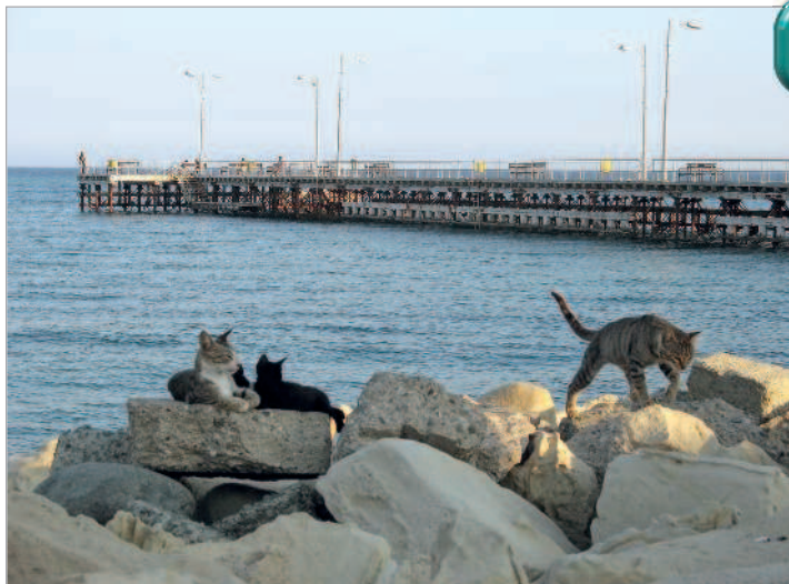
■ Набережная Лимассола

тийскими монастырями и храмами, а также готическими соборами. В наше время большинство памятников тех эпох лежит в руинах, но эти руины придают острову мудрую, вечную красоту.