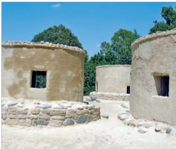
■ Поселение Хирокития. Геометрия вечности