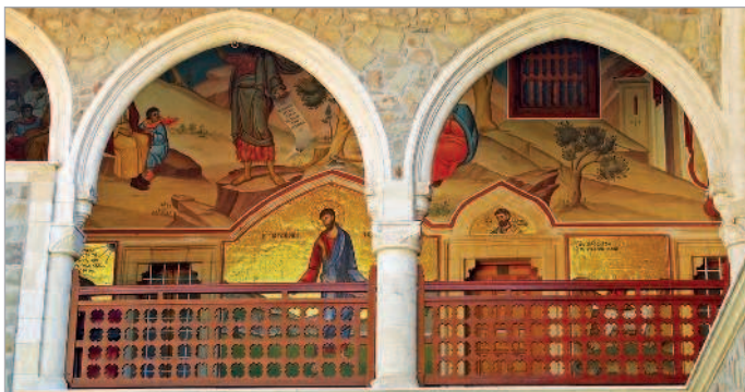
■ Монастырь Киккос

Подробнее о монастыре читайте в главе «Монастыри Троодоса» на с. 82.