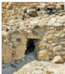
■ Поселение Хирокития. Вход в грот

38 км к юго-западу от Ларнаки, рядом с шоссе Ларнака–Лимассол (А5).