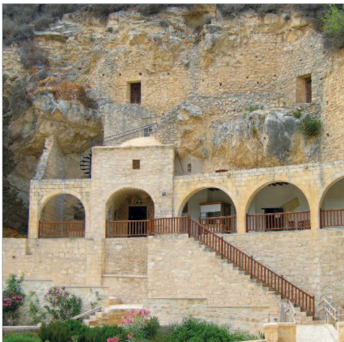
■ Монастырь Св. Неофита Затворника

Подробнее о монастыре читайте в главе «Православные святыни в окрестностях Пафоса» на с. 65.