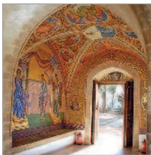
■ Монастырь Киккос. Вход в церковь

В западной части Троодосских гор на высоте 1143 м над уровнем моря на горе Кикко стоит великий православный монастырь Кипра – Киккос. Это одна из самых богатых обителей всего восточного побережья Средиземного моря. Побывать на Кипре и не увидеть Киккос – все равно, что приехать в Москву и не посмотреть храм Василия Блаженного.