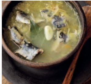
Рыбные щи .....74 Щи из беломорской сельди