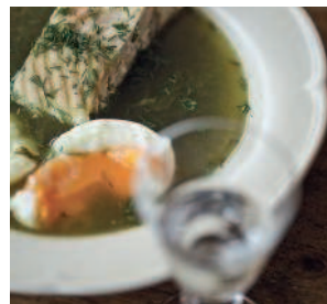
Рахмановские щи .....58