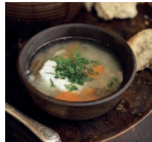
Репня: кислые репьяные.....70 щи с перловкой