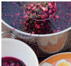
Холодный борщ..... 22 с окороком