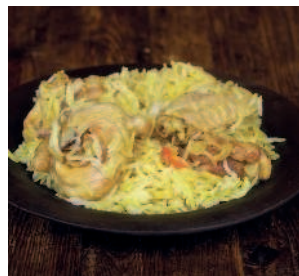
Курица с рисом..... 174