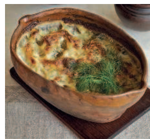
Треска по-поморски..... 132