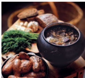
Селянка из свежанины ..... 106