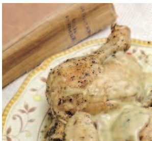
Курица с драгун-травой ... 166