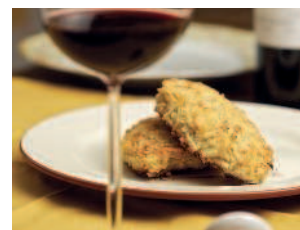
Пожарские котлеты..... 160