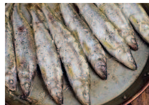
Корюшка ..... 122