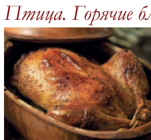
Утка в латке..... 158