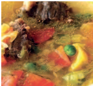
Щи из ранних овощей.....72