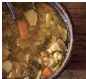
Постная каля..... 100 с солёными грибами