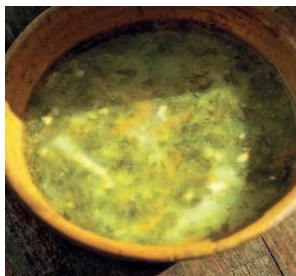
Щавелевая похлёбка, ..... 114 или зелёные щи