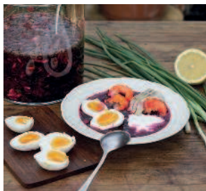
Свекольник, он же холодник .....26