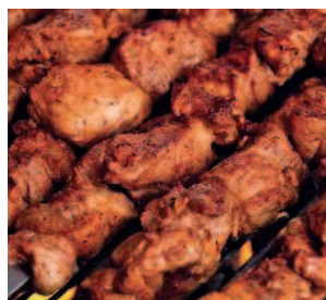
Шашлык ..... 206 из свиной шеи