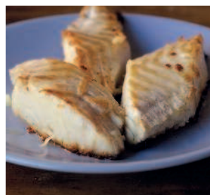
Штокфиш или лабардан .... 128