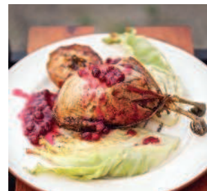
Рябчик..... 176 с ягодным взваром