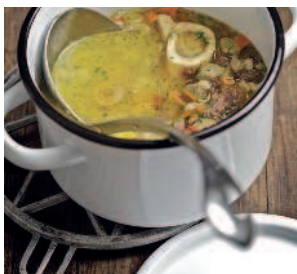
Мясной рассольник .....90