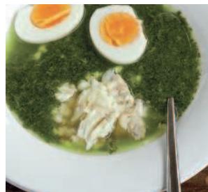
Ботвинья из сныти..... 110