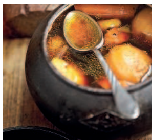
Ушное из баранины.....92