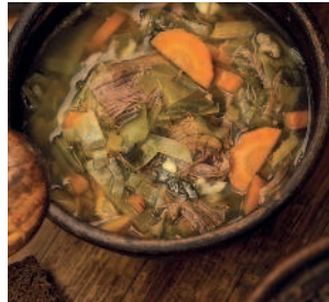
Щи из крошева.....76