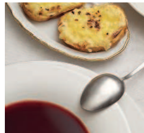
Консоме .....88 борщок с дьяблями