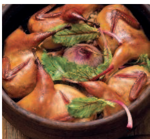
Перепела, ..... 180 чинённые кашей