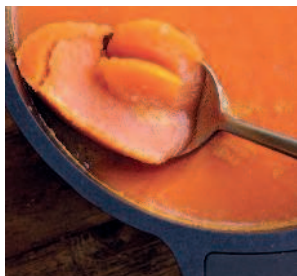
Раковое масло .....52