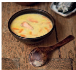
Рыбная похлёбка .....42 на молоке