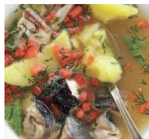
Ростовская уха .....40