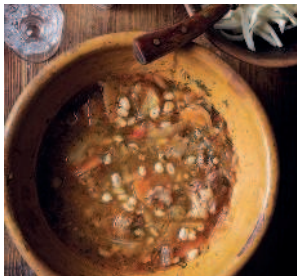
Суточные щи .....66 из квашеной капусты и репы