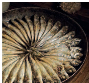
Ставридка..... 136 Шкара