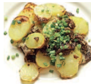
Скобянка ..... 202