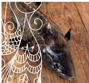
Как разделить осетра ..... 140 или стерлядь