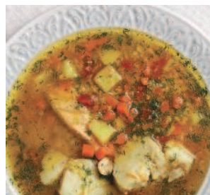
Уха «по-суворовски» .....46