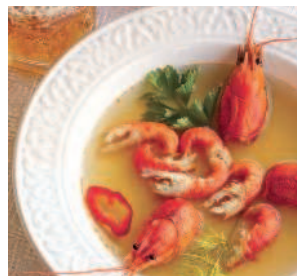
Московский раковый суп....54