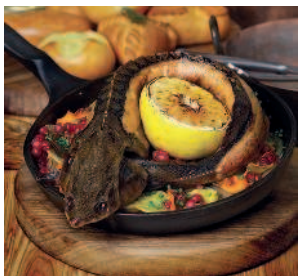
Стерлядь кольчиком..... 152