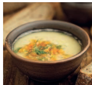
Постная горохово- .....96 ячневая похлёбка