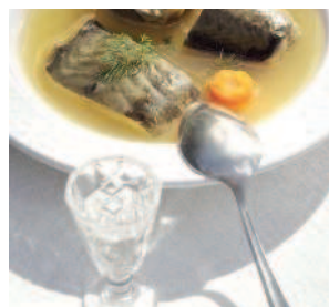
Стерляжья уха .....38