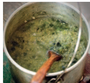
Похлёбка ..... 112 из молодой крапивы