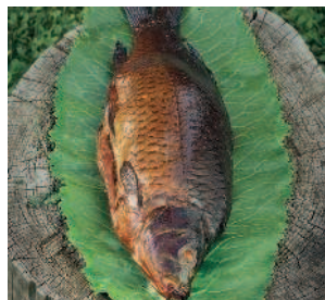
Начинённый карп..... 154