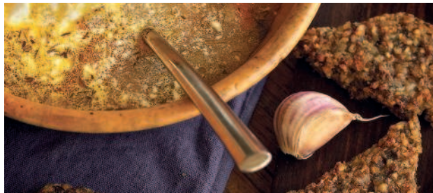
Щи из квашеной капусты ....68 другим манером