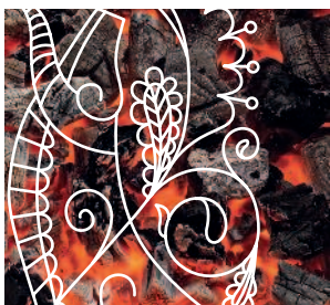
Шашлыки ..... 204