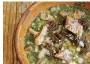
Мурцовка со студнем .....20