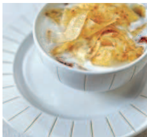
Молочный суп ..... 104 с клёцками