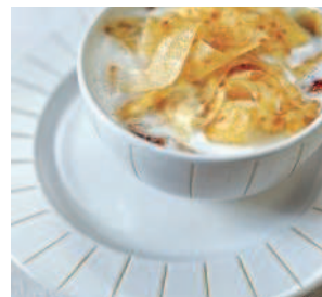
Молочный суп с лапшой... 104 из крахмальных блинов