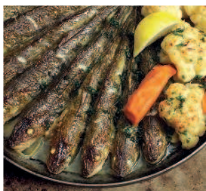
Навага ..... 126