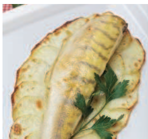
Судачки «а-ля натюрель» .. 124