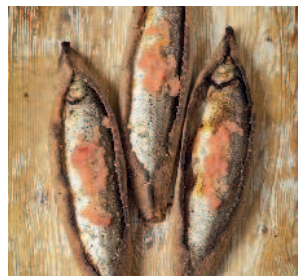
Ряпушка в ржаном тесте..... 146