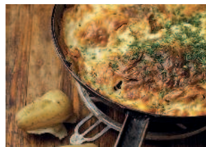
Караси в сметане ..... 120