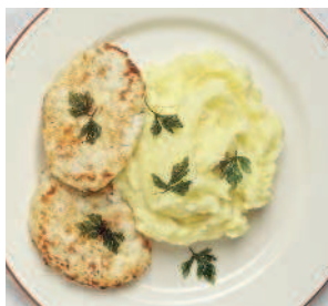
Котлеты из трески..... 134 с творогом