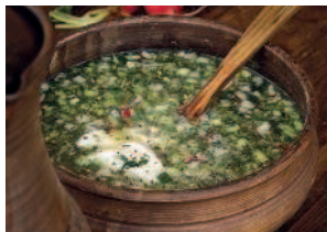
Окрошка..... 16 с отварной курицей