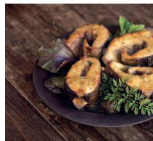
Стерлядь..... 138 в огуречном рассоле