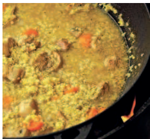
Казацкий кулеш ..... 116