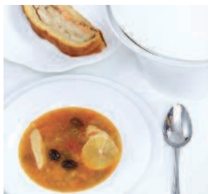
Рыбная солянка .....44