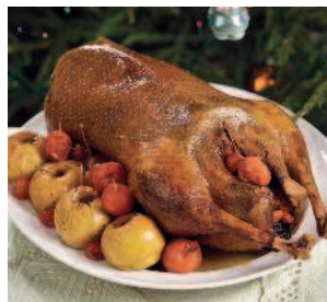
Рождественский гусь ..... 170 с яблоками