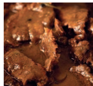
Говядина с ржаным ..... 212 хлебом по-московски