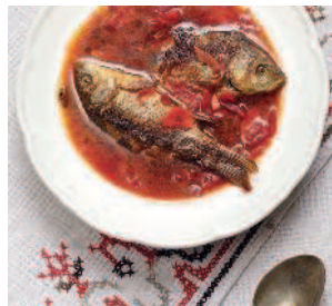
Борщ.....86 с жареными карасями