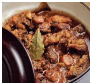
Таранчуг ..... 196