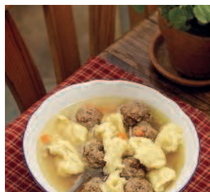
Суп с клёцками.....94 и фрикадельками