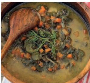
Каля из говяжьих почек.....98