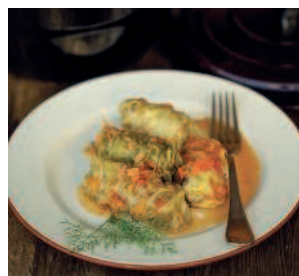
Голубцы ..... 208 из молодой капусты