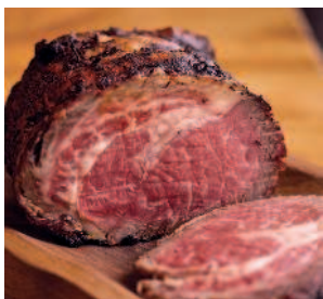
Жаркое..... 192 из Черкасского быка