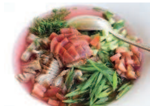
Лёвшинская окрошка ..... 18 со сливами