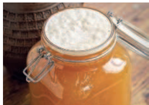
Окрошечный белый квас..... 14