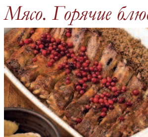
Свиной бок ..... 188 в медово-горчичной глазури