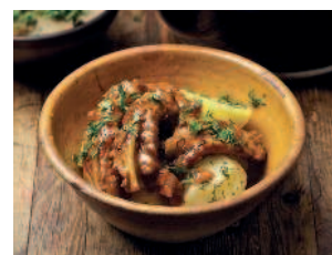
Верещака ..... 190 из свиных рёбер