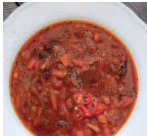
Кубанский борщ.....84 со «старым» салом