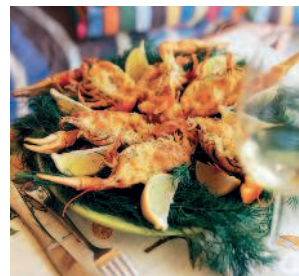
Раки чинённые ..... 150