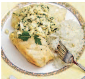
Судак с соусом..... 135 «по-польски»