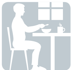
СИДИМ за завтраком