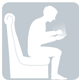
СИДИМ, склонившись над телефоном