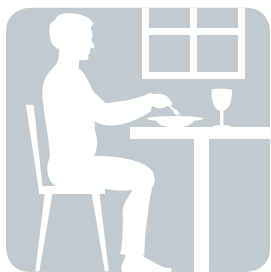
СИДИМ за обедом

Первый доклад Главного военного хирурга США о влиянии недостаточной физической активности на здоровье датируется 1996 годом. Как и в докладе 1964 года о курении табака, в нем привели множество доказательств того, что сидячий образ жизни приводит к многочисленным негативным последствиям для здоровья 10 .