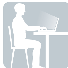
СИДИМ за компьютером