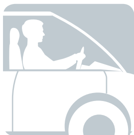
СИДИМ по пути на работу