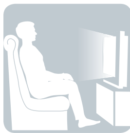
СИДИМ перед телевизором