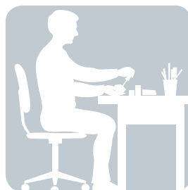
СИДИМ на работе