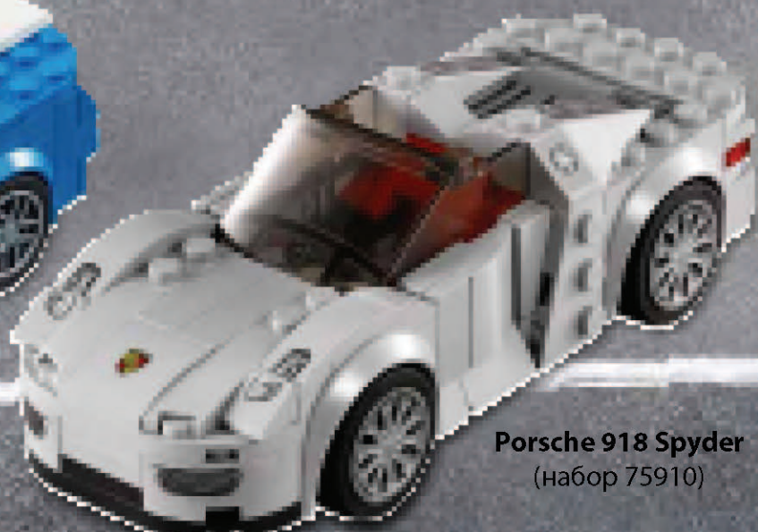
Porsche 918 Spyder (набор 75910)