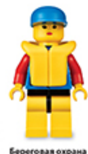
Береговая охрана (1999)