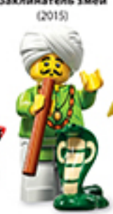
Заклинатель змей (2015)