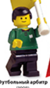
Футбольный арбитр (1998)