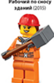
Рабочий по сносу зданий (2015)