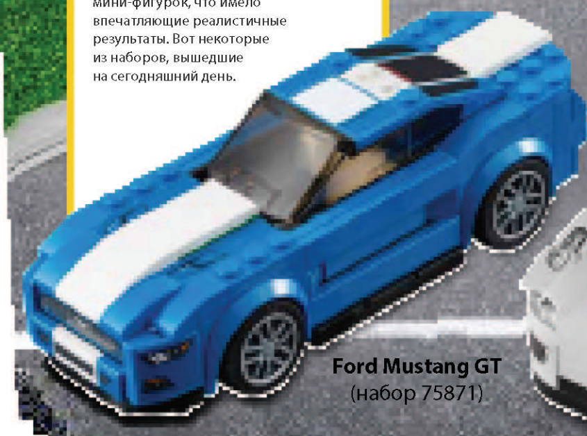
Ford Mustang GT (набор 75871)

С 2015 года серию LEGO® Speed Champions обновили настоящими гоночными автомобилями в масштабе мини-фигурок, что имело впечатляющие реалистичные результаты. Вот некоторые из наборов, вышедшие на сегодняшний день.