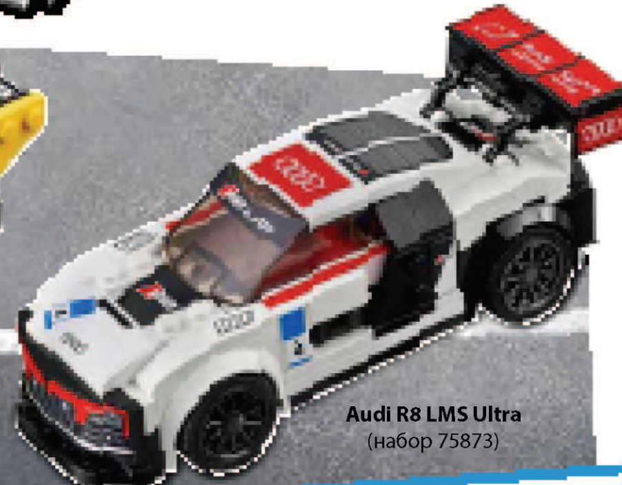
Audi R8 LMS Ultra (набор 75873)