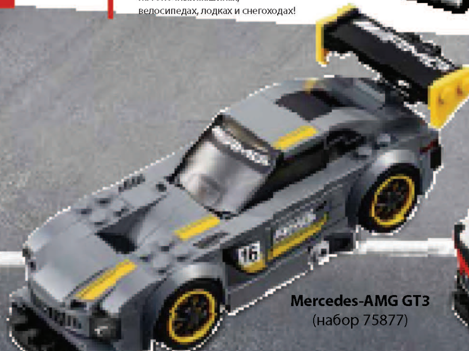
Mercedes-AMG GT3 (набор 75877)