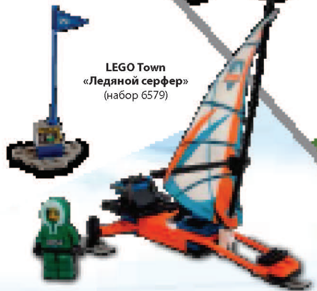
LEGO Town «Ледяной серфер» (набор 6579)