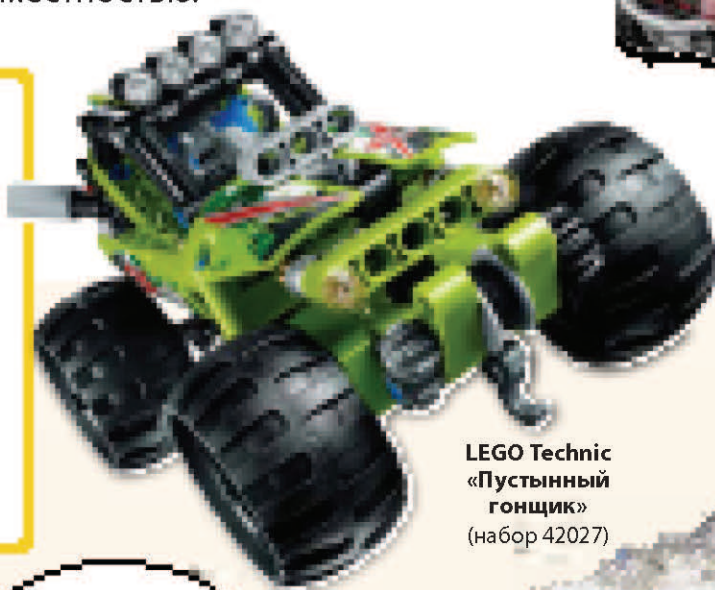
LEGO Technic «Пустынный гонщик» (набор 42027)

Толстые шины этих полноприводных автомобилей преодолевают крутые песчаные дюны. Пляжный скутер LEGO® Friends имеет только три колеса, но тоже легко справляется с песком.