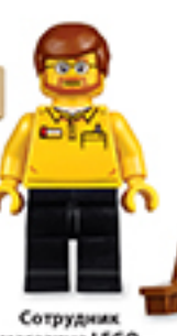
Сотрудник магазина LEGO (2015)