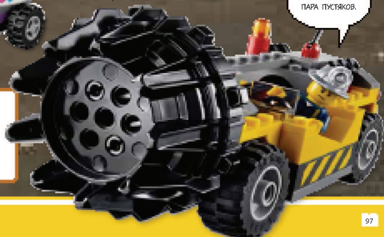
LEGO City «Шахта» (набор 4204)