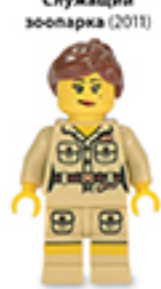
Служащий зоопарка (2011)