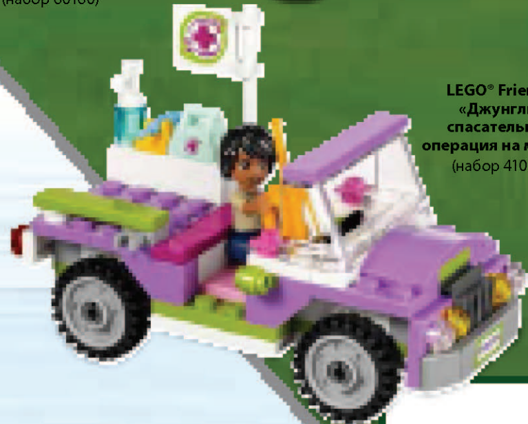
LEGO® Friends «Джунгли: спасательная операция на мосту» (набор 41036)