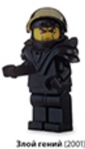
Злой гений (2001)