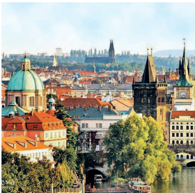
Вид на Прагу

У чехов интересный язык: сочный, яркий, несколько странный для уха говорящих по-русски, так как порой привычные слова здесь имеют совсем иной смысл.