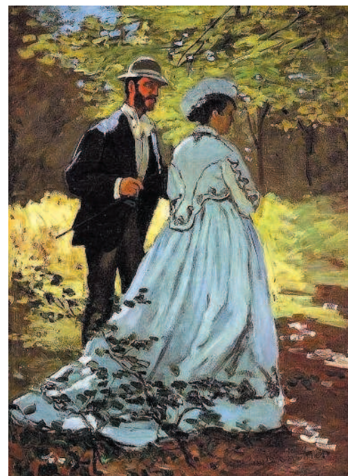
Клод Моне. Прогулка. Базиль и Камилла. 1865 г. Национальная галерея искусств, Вашингтон

Поль Валери. «Дега, танец, рисунок». Перевод В. Козового