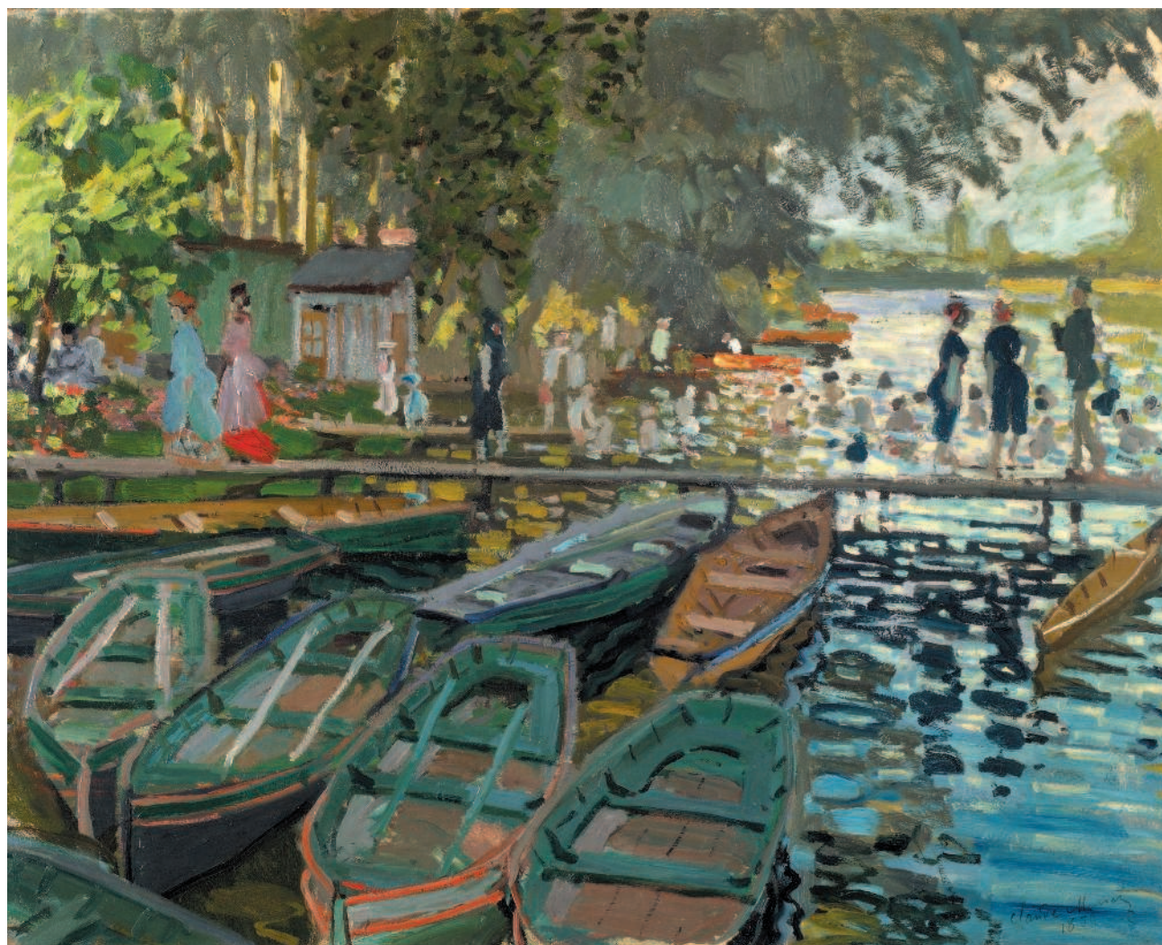
Клод Моне. Купание в Лягушатнике. 1869 г. Национальная галерея, Лондон