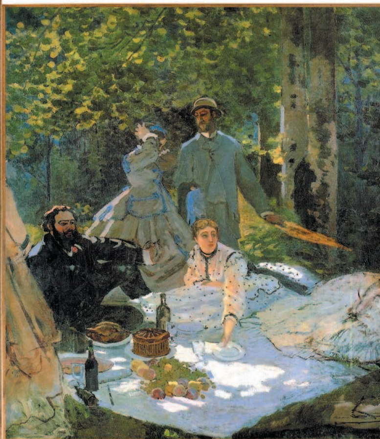
Клод Моне. Завтрак на траве. Левая и центральная панели. 1866—1866 гг. Музей Орсе, Париж

«Предпочитаю дожидаться нового поколения, которое сделает в портрете то, что Клод Моне сделал в пейзаже — богатым и смелым пейзажем в духе Ги де Мопассана».