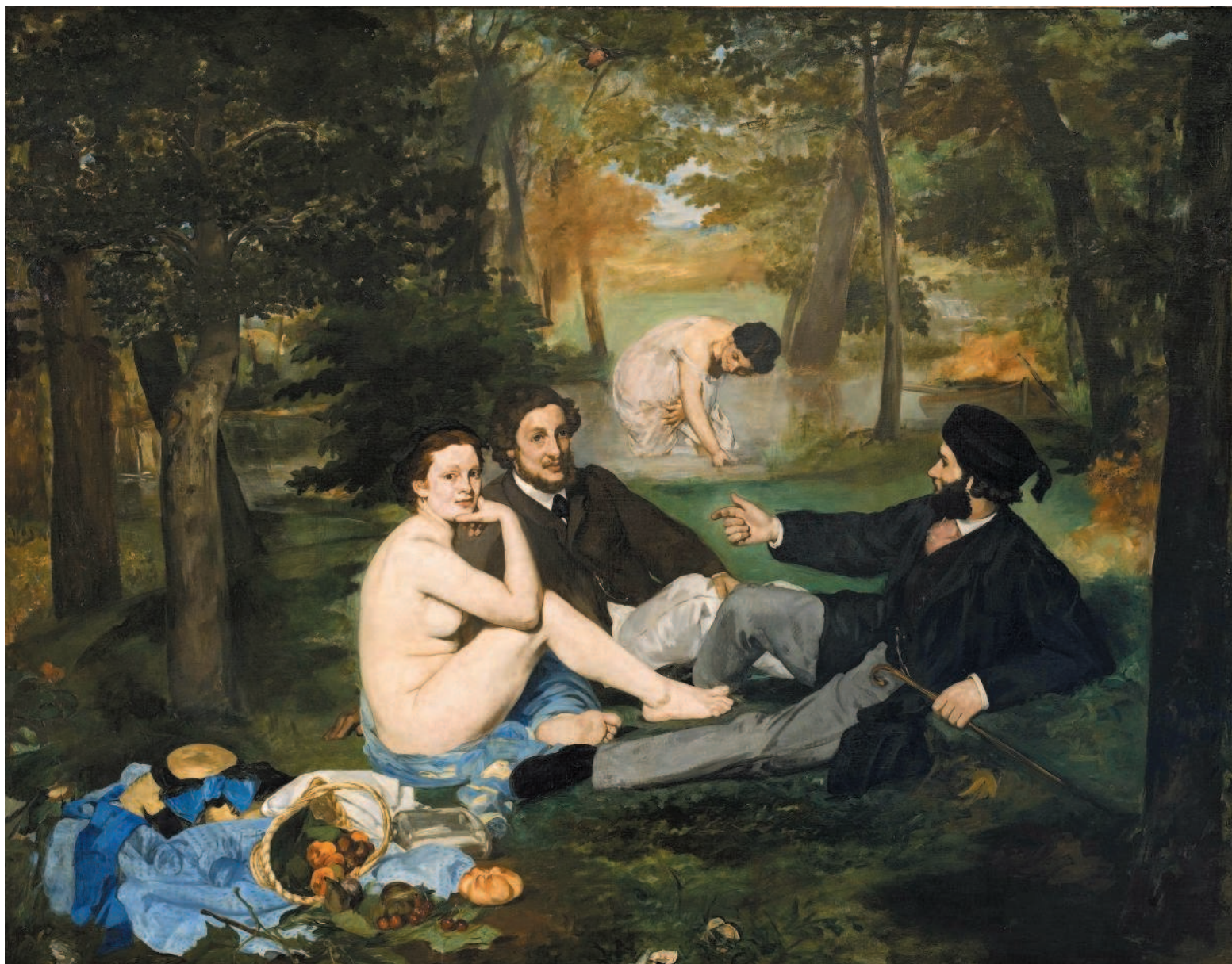
Эдуард Мане. Завтрак на траве. 1863 г. Музей Орсе, Париж

Картина, которой суждено было совершить переворот в живописи, изначально называлась «Купание» — во время одной из прогулок в Аржантее* художник задумал свою идиллию с берегом Сены. Эта работа — современная вариация на тему джорджоневского «Сельского концерта», отсылающая еще и к рафаэлевскому «Суду Париса», — была представлена в «Салоне Отверженных» и оттуда вошла в историю искусства как «Завтрак на траве». Девушка с Монматра Викторина Меран (любимая натурщица Мане в 60-е годы: в ее