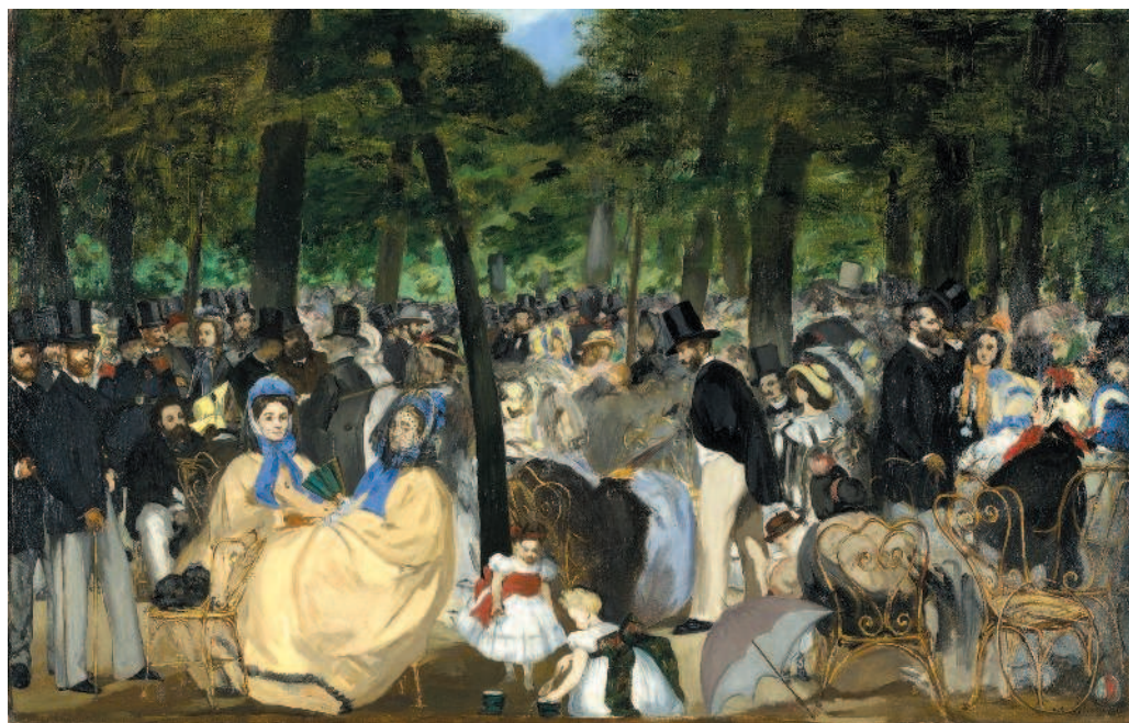
Эдуард Мане. Музыка в Тюильри. 1862 г. Национальная галерея, Лондон. На с. 3. — увеличенный фрагмент картины

Нельзя сказать, что император сознательно стал «крестным отцом» нового искусства, получившего яркую и убедительную