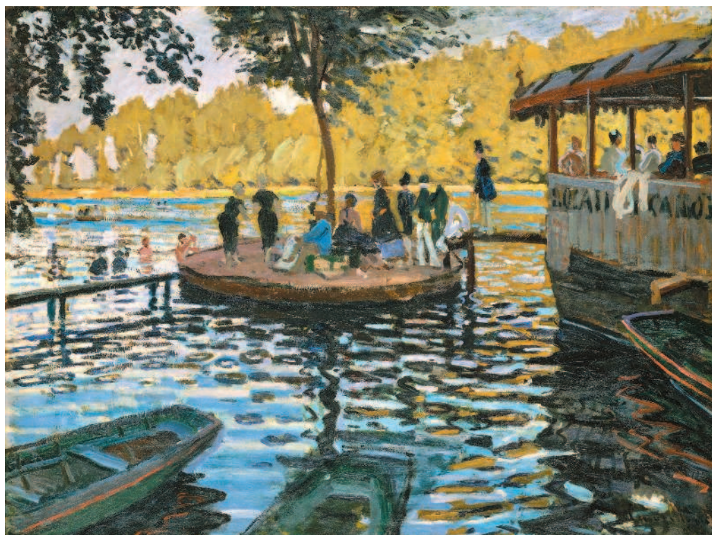
Клод Моне. Лягушатник. 1869 г. Метрополитен-музей, Нью-Йорк