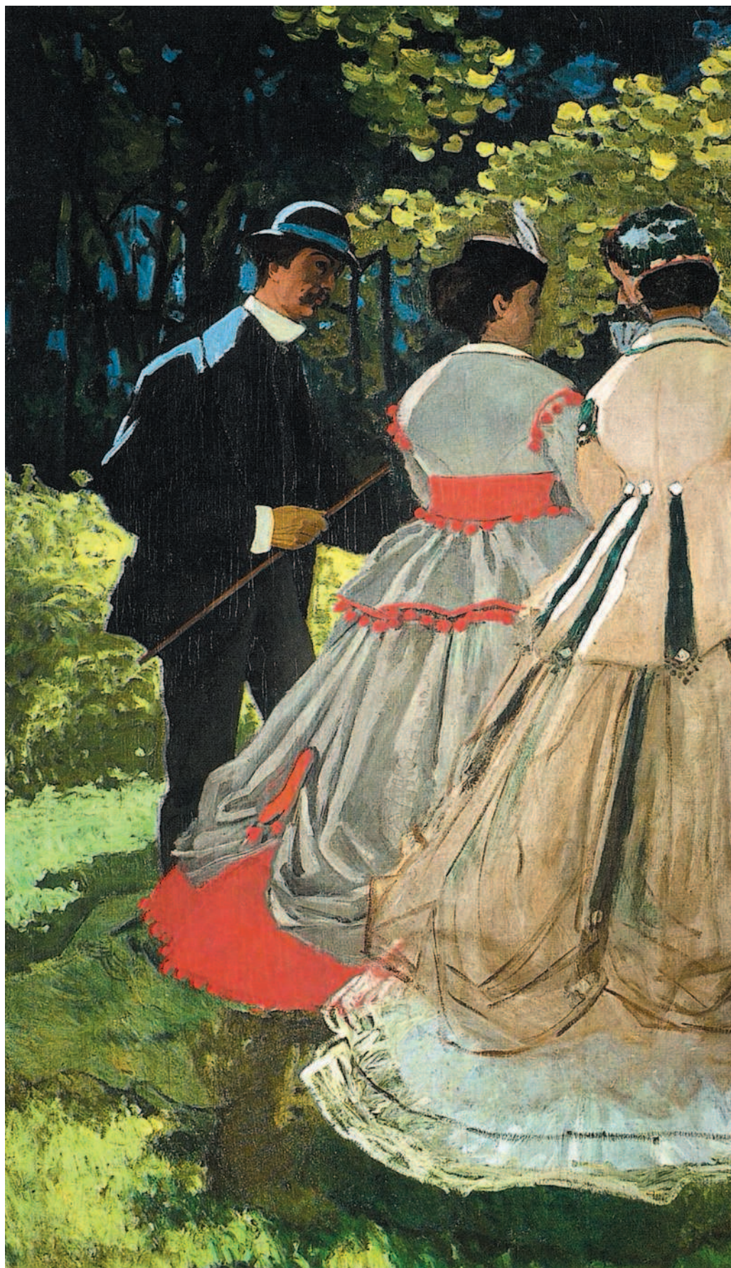
Клод Моне. Завтрак на траве.